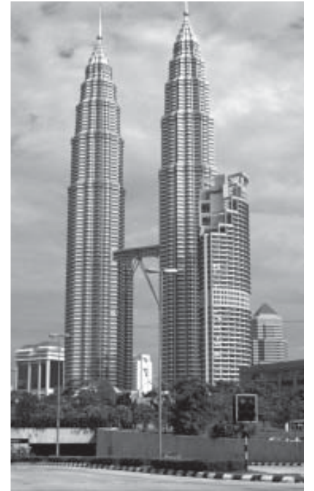
5. Cesar Pelli & Associates architectes, les tours Petronas, Kuala Lumpur (Malaisie), 1999

Dans un autre domaine, le terme d'art islamique semble, en pratique, renvoyer à la religion plutôt qu'à la culture : dans le contexte nord-américain, le climat social qui a suivi le 11 septembre a conféré au marqueur « musulman » une actualité sans précédent, et une valeur péjorative dans la vie quotidienne. Aux États-Unis, « musulman » devint synonyme de l'Autre qu'il était permis de haïr ouvertement. Cette « interpellation de l'Autre » a mis l'accent sur la nécessité, pour ceux qui la partageaient, de reconquérir leur identité sous un jour plus favorable. Mon expérience en tant que professeur d'art et architecture islamiques dans trois universités américaines (dans le Massachusetts, le Texas et la Californie) m'a montré qu'un pourcentage significatif – je dirais près de 40 % – des étudiants qui s'inscrivent aux cours d'art et architecture islamiques, en particulier en licence, le font explicitement parce qu'ils sentent que de tels cours concernent