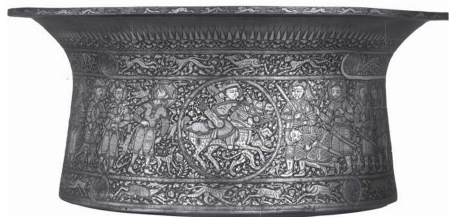
7. Muhammed Ibn-al-Zayn, bassin dit « Baptistère de saint Louis », laiton incrusté d'or et d'argent, vers 1300, Paris, Musée du Louvre.