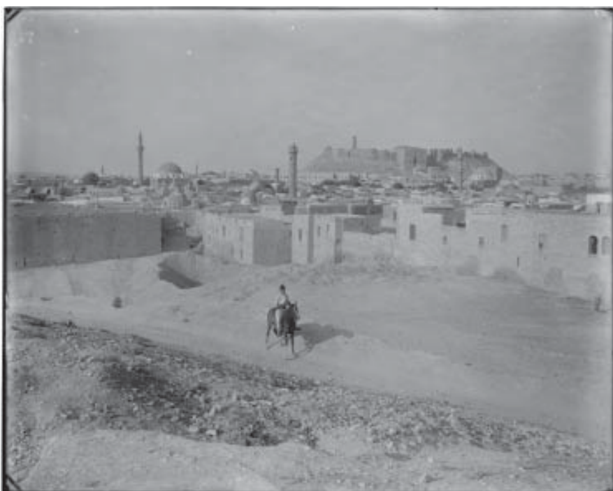
4. Vue d'Alep (Syrie), une des villes au centre du « débat sur la ville islamique », photographie de la première moitié du XX e siècle, Washington, Library of Congress.

Il peut être – et a été – défendu que le qualificatif d'art islamique est hautement imparfait. Cette catégorie résiste pourtant. Dans ces circonstances, il est peut-être intéressant de déterminer non pas tant l'origine du terme que la manière dont il est demeuré opératoire dans l'histoire de l'art occidentale au cours du XX e siècle, et s'il est toujours compris de la même façon.