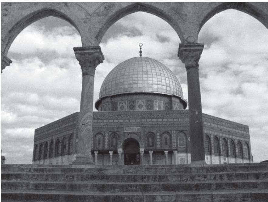
2. Le dôme du Rocher à Jérusalem, le plus ancien édifice musulman encore existant, achevé en 691.

sont déconnectées l'une de l'autre. Ce fait est – en partie – imputable aux origines de ce domaine d'étude et à l'attention concentrée initialement sur les « terres islamiques centrales ». Mais cela n'explique pas tout.