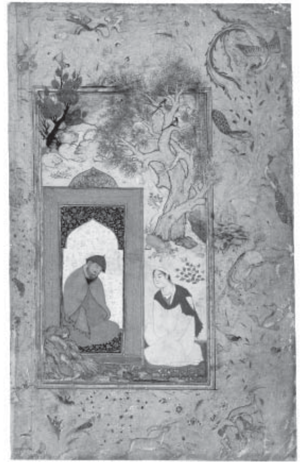
3. Jeune homme visitant un derviche, gouache provenant d'Iran, début du XVII e siècle, Paris, Musée du Louvre.